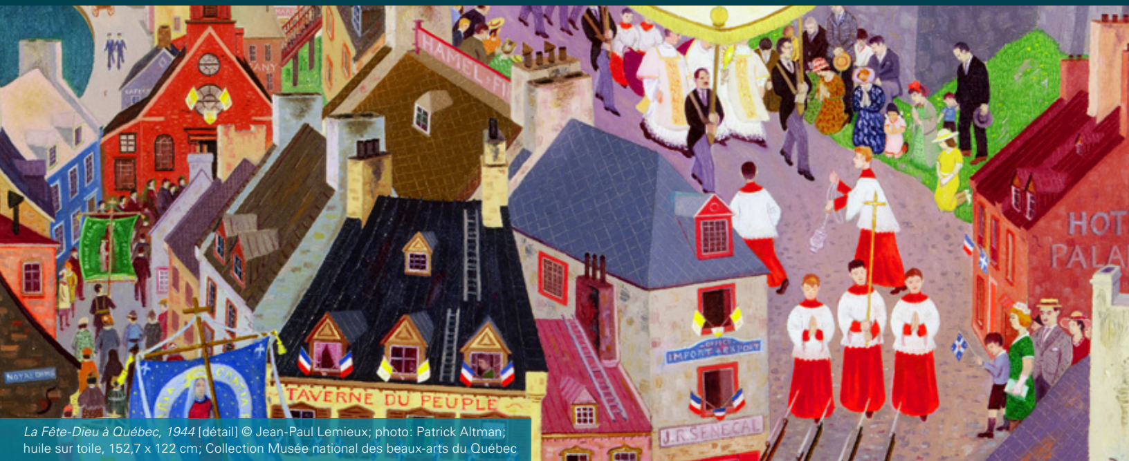
La Fête-Dieu à Québec, 1944 [détail] © Jean-Paul Lemieux; photo: Patrick Altman; huile sur toile, 152,7 x 122 cm; Collection Musée national des beaux-arts du Québec