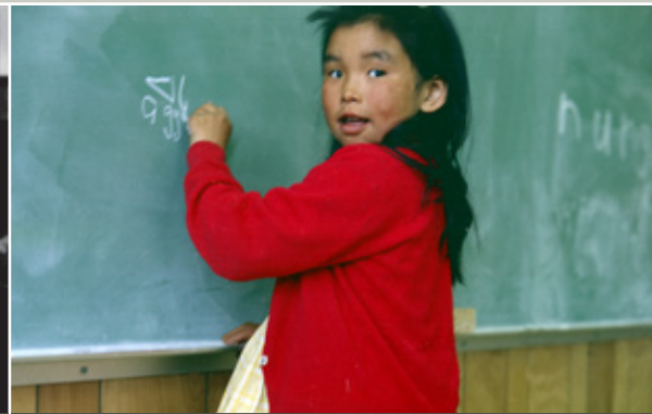
Élèves en classe [détail].