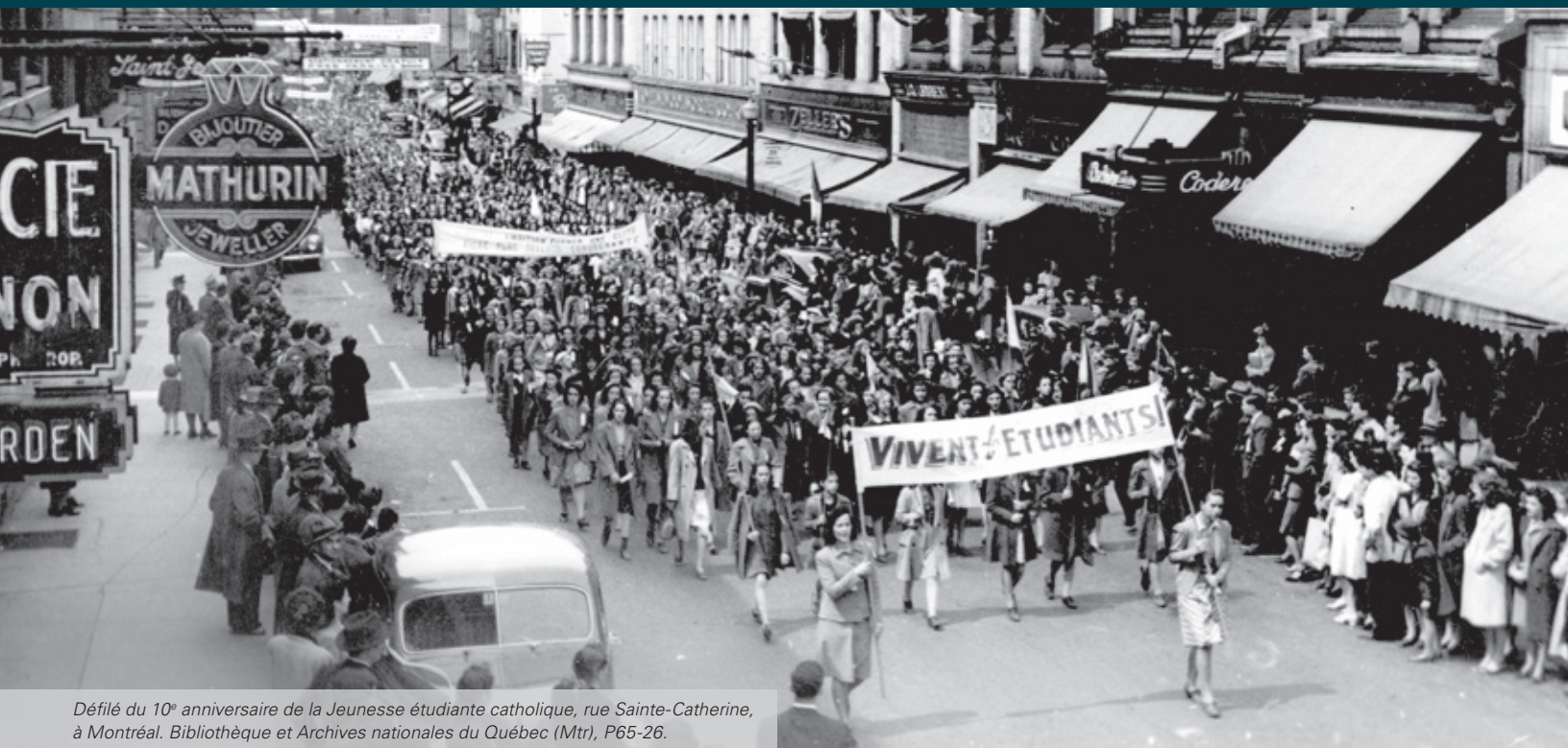
Défilé du 10 e anniversaire de la Jeunesse étudiante catholique, rue Sainte-Catherine, à Montréal. Bibliothèque et Archives nationales du Québec (Mtr), P65-26.